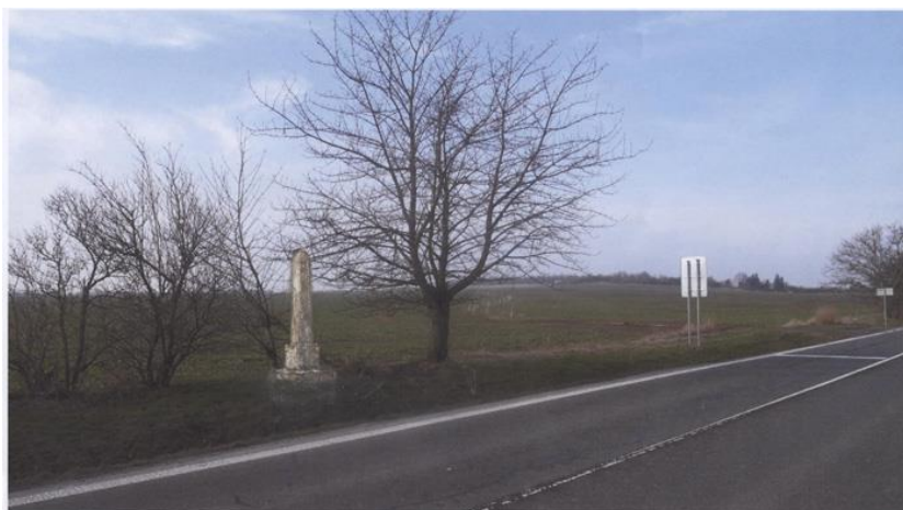
jeden z návrhů

Představil jsem mu tři verze obnovy rozcestníku. Poté jsem musel několik týdnů počkat na vyjádření suchdolské rady.